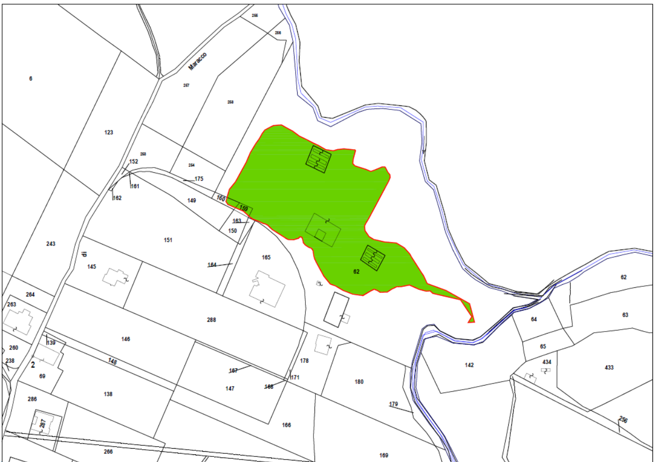
Sovrapposizione carta regionale e catasto bosco