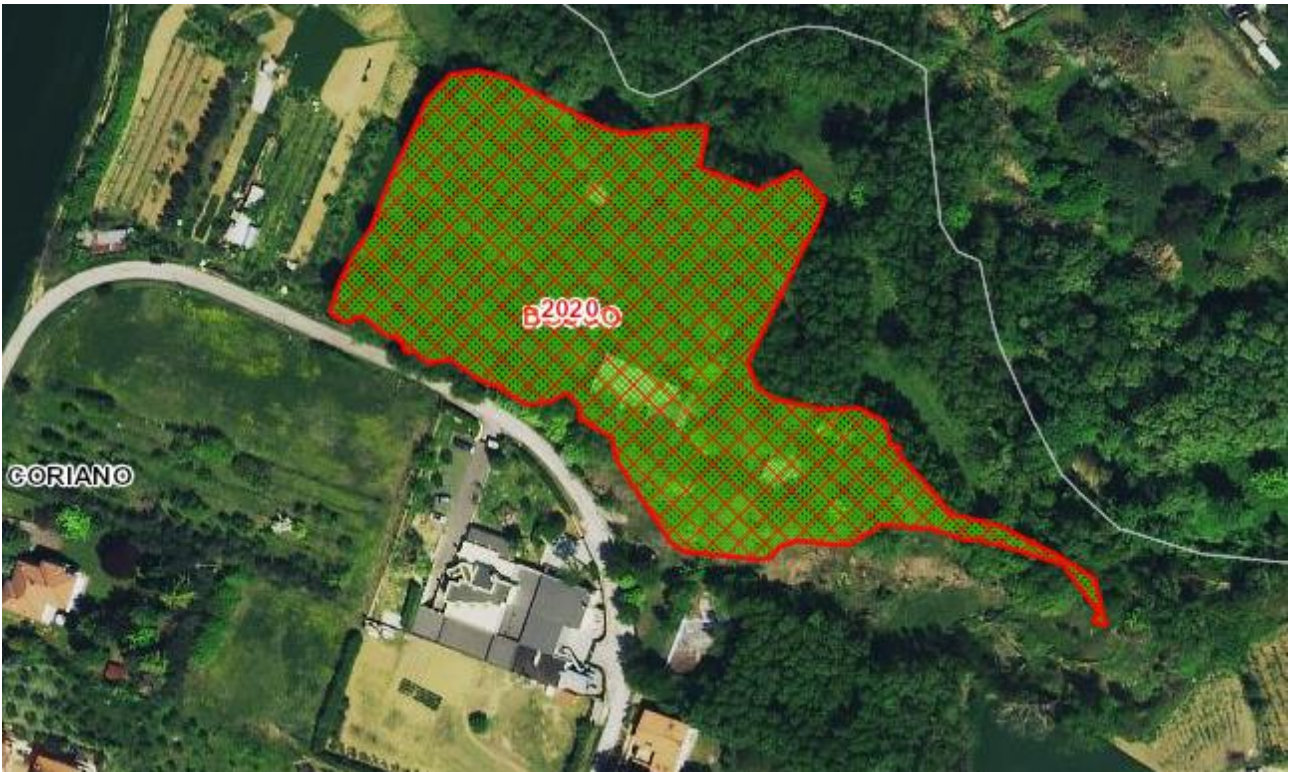
Estratto cartografia digitale regionale – aree percorse dal fuoco