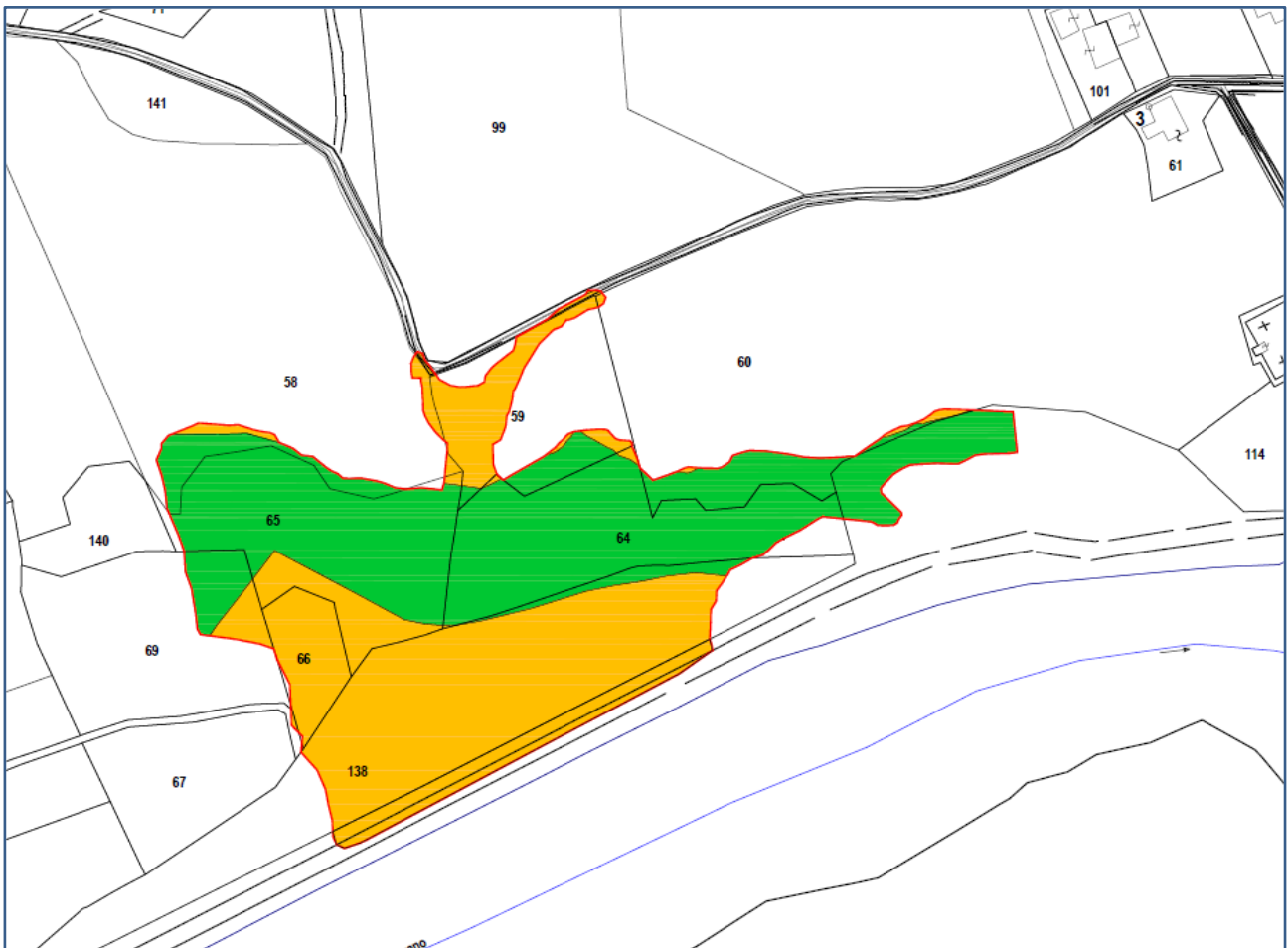
Sovrapposizione carta regionale e catasto