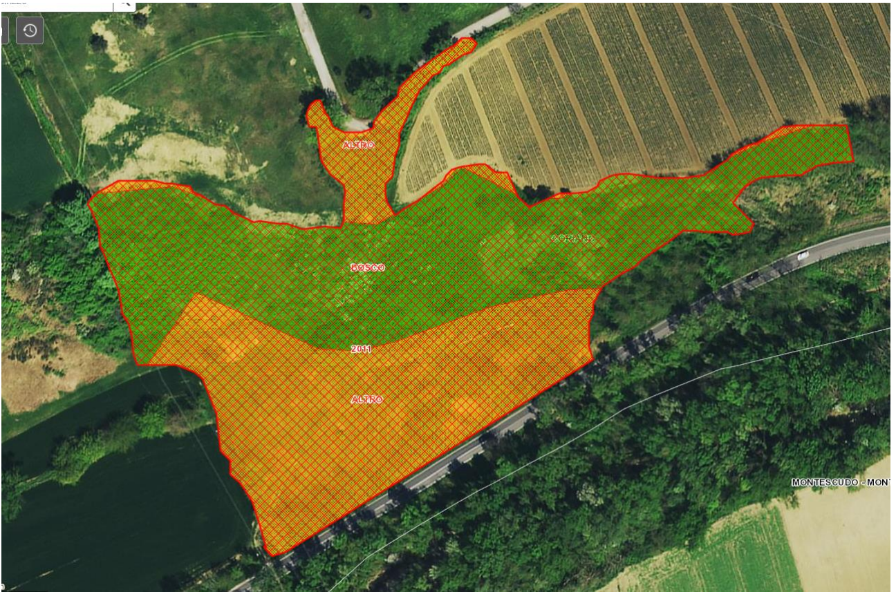
Estratto cartografia digitale regionale – aree percorse dal fuoco