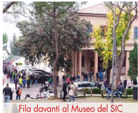
Fila davanti al Museo del SIC

Da venerdì 22 ottobre fino a lunedì 25, secondo i dati forniti dai responsabili della struttura, sono stati 1.184 i visitatori con una punta massima di 484 ingressi nella sola giornata di sabato 23, grazie alla disponibilità della famiglia, il ricordo del campione resta vivo nei cuori di tutti. Testimonianze ne sono state la grande partecipazione alla funzione religiosa celebrata per l'occasione e all'accensione della fiamma del Sic. E' l'ennesima conferma che la scelta di allestire un Museo nel ricordo di Marco, sostenuta a suo tempo da questa Amministrazione, era quella giusta. La vera festa per ricordare Marco è fissata alla data del suo compleanno, il prossimo 20 gennaio quando simbolicamente Coriano e tutti i tifosi si stringeranno alla famiglia del nostro campione in un abbraccio con lui che ci segue da lassù.