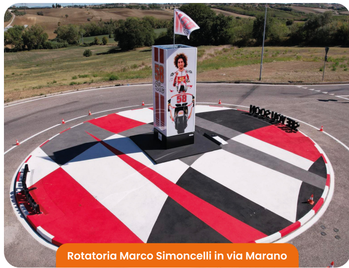
Rotatoria Marco Simoncelli in via Marano