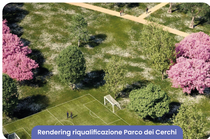
Rendering riqualificazione Parco dei Cerchi

Dopo il parco dei Cerchi seguiranno analoghi interventi di rigenerazione ai parchi Bellini di S. Andrea in Besanigo, Viganò di Ospedaletto e al parco Del Sole di Cerasolo.