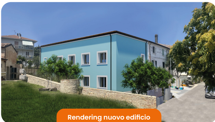
Rendering nuovo edificio