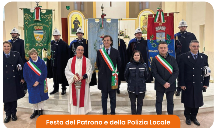
Festa del Patrono e della Polizia Locale

Il 20 gennaio è stata celebrata la messa officiata da don Osvaldo Caldari in occasione di San Sebastiano, patrono del Comune. Come da tradizione alla messa è seguito un corteo per la deposizione di una corona di alloro presso la statua di San Sebastiano in piazza Don Minzoni. In programma anche uno spettacolo a Teatro Corte e il giorno seguente la tradizionale podistica Trofeo di San Sebastiano organizzata da Gruppo Podismo Cerasolo.