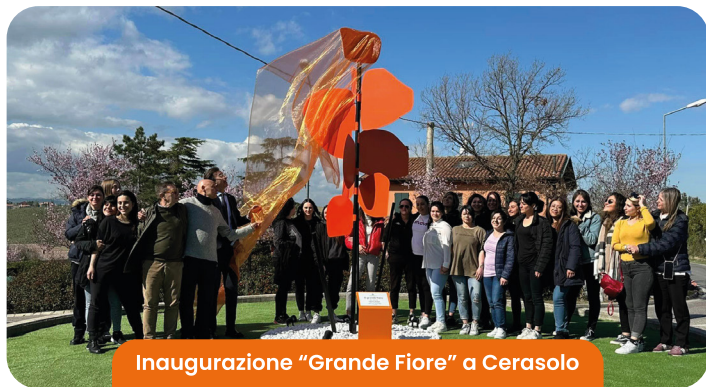
Inaugurazione "Grande Fiore" a Cerasolo

La cerimonia della panchina è stata preceduta dall'inaugurazione del "Grande Fiore" a Cerasolo. La scultura donata dal poliedrico artista Gabriele Gambuti è realizzata in ferro con steli neri e petali arancioni. Gambuti è autore di quadri, sculture, ceramiche e installazioni presentate anche in ambito internazionale. Nel 2017 e nel 2019 ha partecipato alla Biennale d'Arte a Venezia. È vincitore di numerosi premi e concorsi.