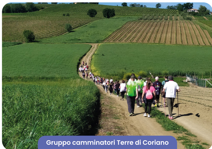
Gruppo camminatori Terre di Coriano

Le iniziative delle associazioni G.S. Ospedaletto, Le Saline Natura e Sport e Benessere Le Saline Shiatsu portate avanti con il contributo e patrocinio del comune di Coriano sono rivolte a tutti coloro che nel rispetto dell'ambiente amano vivere il proprio tempo libero all'aria aperta. Escursionisti e appassionati di bicicletta possono vivere i meravigliosi paesaggi che offre il nostro territorio con sentieri naturalistici e percorsi dedicati.