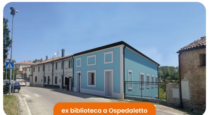
ex biblioteca a Ospedaletto