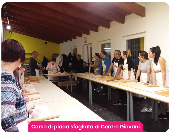
Corso di piada sfogliata al Centro Giovani

Il Centro Giovani è un luogo di aggregazione e socializzazione aperto a tutti, dalle associazioni del terzo settore ai giovani che dagli annessi impianti sportivi hanno la possibilità di partecipare a tante iniziative.