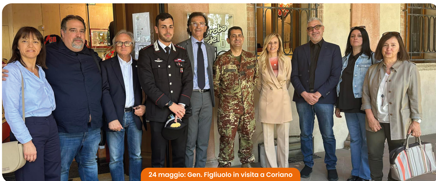
24 maggio: Gen. Figliuolo in visita a Coriano

SEGNALAZIONI GUASTI ILLUMINAZIONE PUBBLICA TEL 0541 601025 ATTIVO H24 manutenzione@antoniolisrl.com