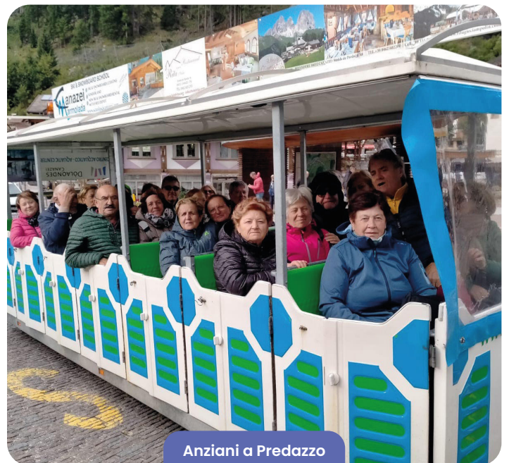
Anziani a Predazzo

Anche quest'anno abbiamo pensato ai nostri anziani organizzando e dando un supporto economico e logistico per un soggiorno montano a Predazzo, a cui hanno partecipato 40 persone.